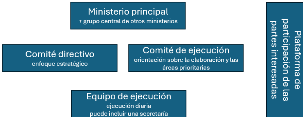
Imagen 1: Una posible estructura de gobernanza de un paquete nacional, considerando que no todos los componentes son aplicables a todos los países.

subnacionales, pueblos indígenas, comunidades locales, la sociedad civil y entidades nacionales del sector privado. El país de acogida puede optar por utilizar las plataformas de participación existentes o crear un enfoque personalizado para la plataforma nacional.